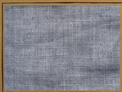
リネン L/25 平